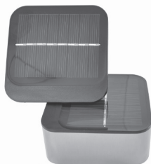
Nesprávne umiestnenie solárnych panelov

Obidva panely by teraz mali byť plne odhalené pre slnečné žiarenie (viď. správne umiestnenie solárnych panelov na obrázku hore). Naklonenie spodného solárneho panelu nie je možné. Na dosiahnutie najlepšieho prísunu slnečných lúčov sa môže naklonať vrchný solárny panel, tak ako je popísané vyššie. Nenechávajte vrchný solárny panel v polohe, ktorá by tienila spodnému solárnemu panelu (viď. nesprávne umiestnenie solárnych panelov na obrázku hore.) Ak potrebujete aby bol vrchný panel natočený na iný smer než spodný panel, jemným potiahnutím odstráňte solárne panely z difuzóra, otočte na požadovaný smer a pripevnite naspäť k difuzóru.