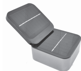
Správne umiestnenie solárnych panelov